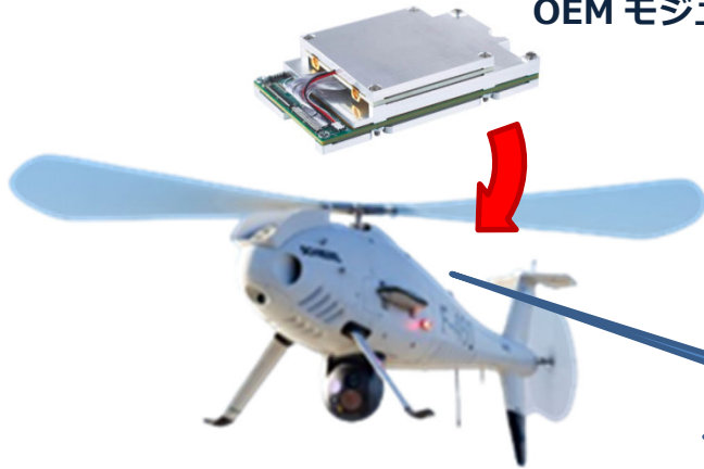
SC4200 OEM モジュール

Silvus 社の Stream Caster 無線通信システムは、最も先進の MIMO 技術を採用した無線通信システムです。SC4200EP シリーズは、2x2 MIMO クラスで最高の性能と効率をコンパクトな筐体で実現しています。