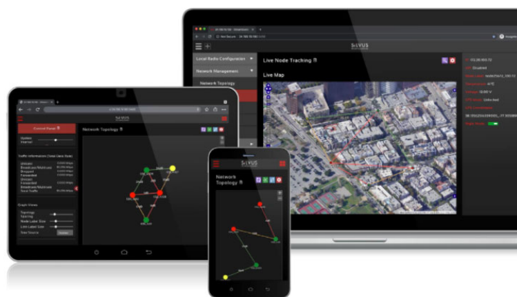
SC4200 OEM モジュール